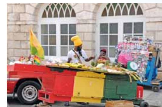
Prodáváče ovoce – Montego Bay