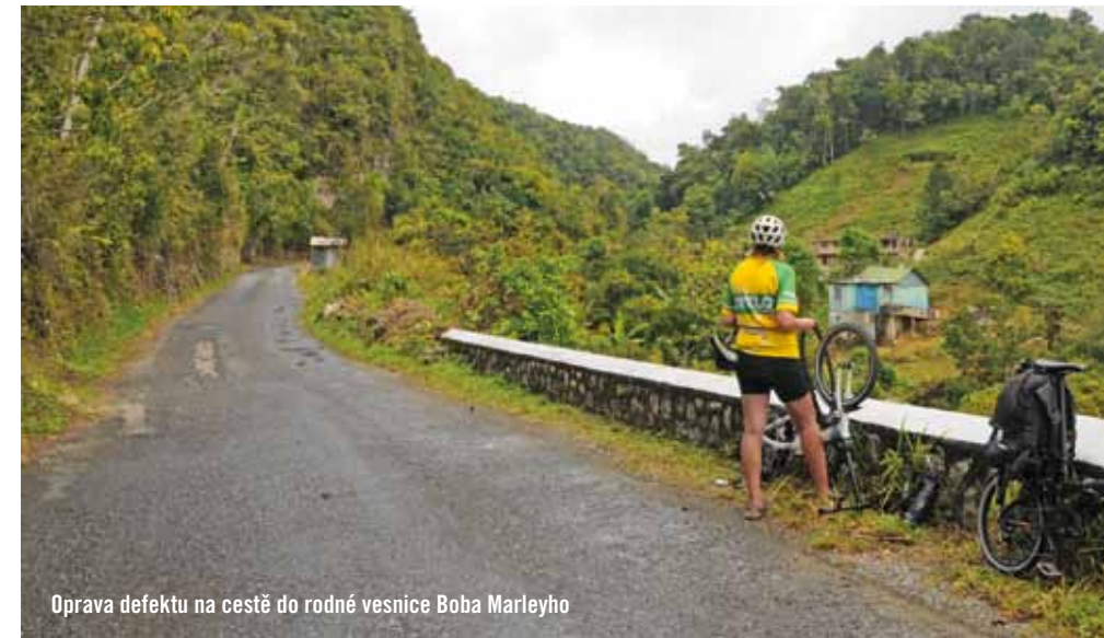
Oprava defektu na cestě do rodné vesnice Boba Marleyho

Nikdy jsem se na dovolené necítila šťastněji než během těchto čtrnácti dní na Jamajce. Že by za to mohla ta neustálá inhalace všudypřítomné vůně marihuany, která zmizela až po zaklapnutí dveří letadla?