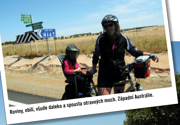
Roviny, obilí, všude daleko a spousta otravných much. Západní Austrálie.

Pobřežní cyklostezka v Esperance. Pod rozpáleným sluncem, ve 38 °C, se jedeme zchladit na známou a krásnou pláž Twillight.