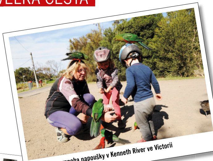
Krásný den s mnoha papoušky v Kenneth River ve Victorii