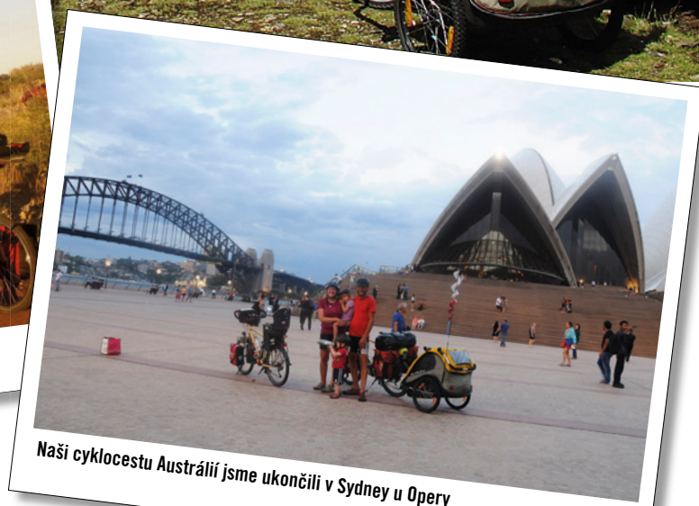
Naši cyklocestu Austrálii jsme ukončili v Sydney u Opery