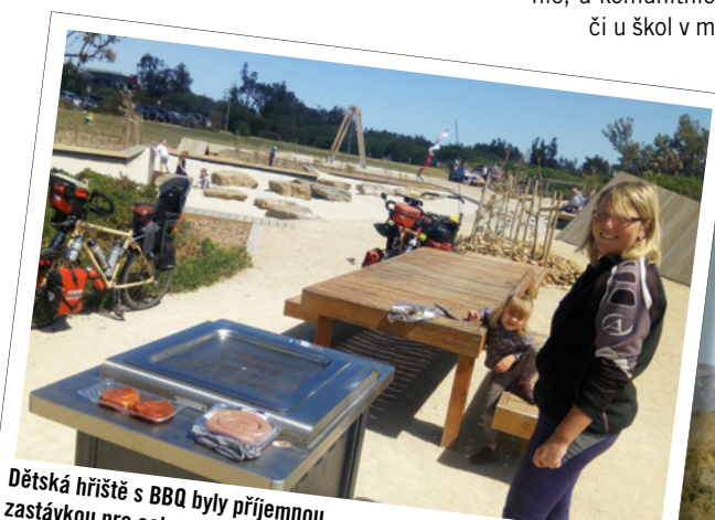
Dětská hřiště s BBQ byly příjemnou zastávkou pro celou naši rodinu