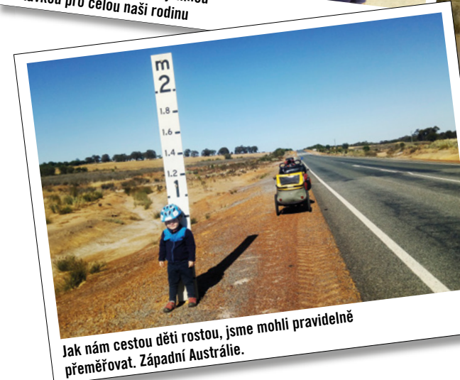
Jak nám cestou děti rostou, jsme mohli pravidelně přeměřovat. Západní Austrálie.

Obě děti jsem v celé Austrálii vezla jen 2 km. Otravné mouchy několik set kilometrů.