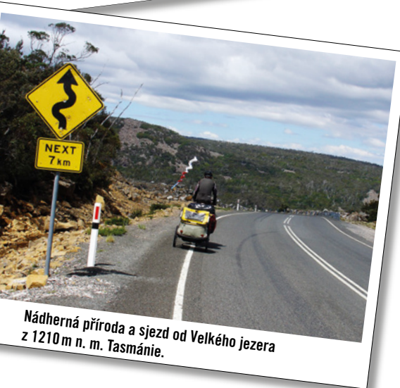
Nádherná příroda a sjezd od Velkého jezera z 1210 m n. m. Tasmánie.

museli jezdit často v moskytiérách, v noci komáři, všudypřítomní papoušci všech barev a velikostí, possumi a tak dále. Vše tady vyjmenovat nejde. Samozřejmě panovaly obavy z hadů a pavouků a všemožné havěti,