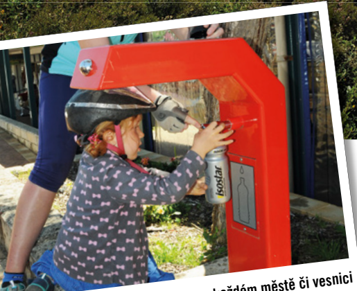
Pitná voda je k dispozici skoro v každém městě či vesnici