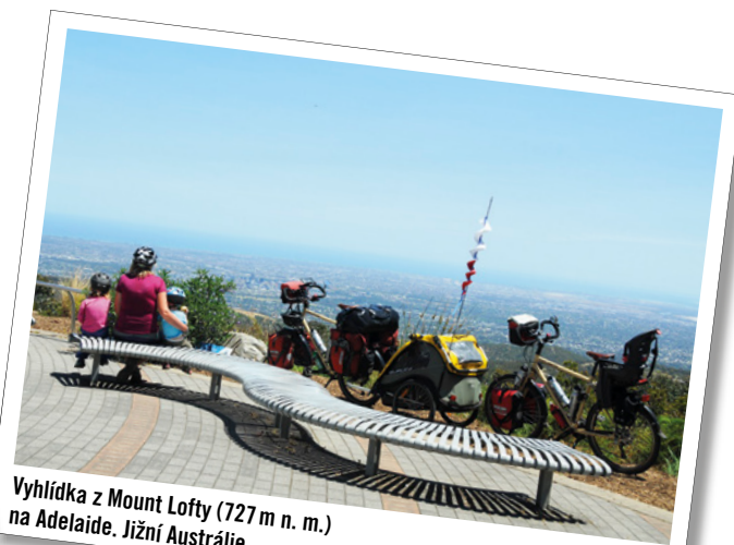
Vyhlička z Mount Lofty (727 m n. m.) na Adelaide. Jižní Austrálie.