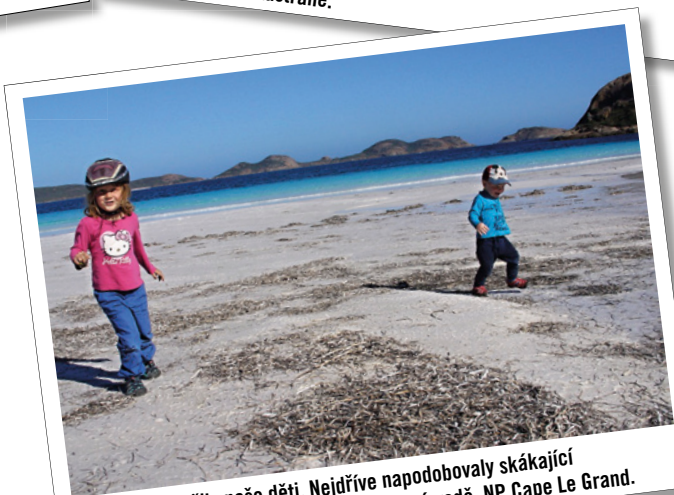
Lucky Bay si užily naše děti. Nejdříve napodobovaly skákající klokan a pak došlo i na koupání v chladné vodě. NP Cape Le Grand.

spíš byl o nich dopředu vědět. To, že se to někde nesmí, značily cedule. V národních parcích se může nocovat jen v oficiálních placených tábořištích.