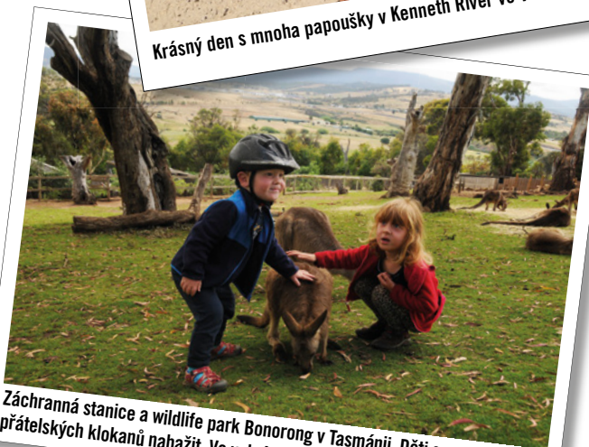
Záchraná stanice a wildlife park Bonorong v Tasmánii. Děti se nemohly přátelských klokanů nabažit. Ve volné přírodě jsou to plachá zvířata.