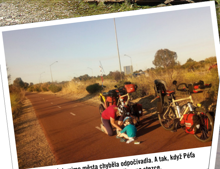
Na cyklostezkách mimo města chyběla odpočívadla. A tak, když Pěta potřeboval přebalit, řešilo se vždy vše přímo na stezce.