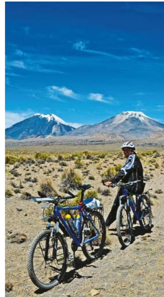
Naše kola konečně vjela na kamenitou půdu Altiplana – legendární náhorní plošiny oddělující západní a východní masiv And. Po tibetské plošině je tato vyprahlá pustina druhým největším podobným útvarem na Zemi. Silnice ze San Pedra de Atacama do Calamy jako by vedla okrajem měsíčního údolí.

Ani v Ekvádoru kopce nepolevovaly, ba naopak. Sotva jsme se vyškrábali někam na vrchol, okamžitě nastal sjezd do hlubokého údolí, přešel se most přes řeku a opět přišlo šlapání do kopce. Fyzicky to bylo opravdu náročné. Odměnou nám však byly překrásné výhledy do okolní krajiny, které na rovinatých pláních nikdy nevidíte. Přiblížila se první „dovolená“ na naší expedici. V hlavním městě Quito jsme nechali kola a letěli se podívat na vysněné Galapágy. Neplánovaná osmidenní plavba po okolních ostrovech nás zcela ohromila. Průzračně čistá voda moře, ty nejkrásnější pláže a nádherná sopečná krajina s mnoha útvary se snad ani nedá popsat. A zvířata, která nenajdete v žádné zoo na světě – obrovské kolonie albatrosů, kormoránů, překrásný