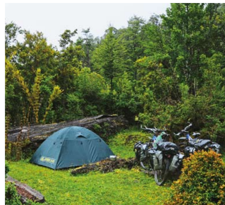
Stanování v Patagonii u legendární dálnice Carretery Austra, kterou nechal vybudovat generál Pinochet, aby zpřístupnil jih země.

Z La Paz jsme se už moc těšili na to právě bolivijské Altiplano a mířili do národního parku Sajama. Když jsme odbočili z pěkné asfaltové silnice do 11 kilometrů vzdálené vsi Sajama, netušili jsme, co nás tam čeká. Projet zmíněnou cestu nám trvalo skoro dvě a půl hodiny! Hluboký písek, do kterého se zařezávala kola jak nůž do másla, spolu s protivětrkem nás nutily kola asi tři kilometry tlačit. Sami jsme nevěřili, že takhle může vypadat cesta, a to jsme ještě netušili, co přijde v dalších dnech. Dlouhé kilometry v hlubokém šterku nebo kamení