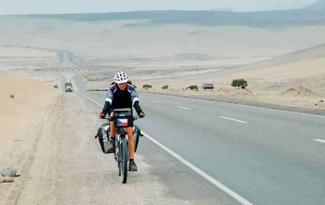
Typické okolí Panamericany na sever od Limy