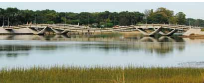
Punta del Este – vlnitý most

Chuy (Ur.) a Chui (Br.), ale ve skutečnosti je to opravdu jedno větší šmelinářské městečko. Nijak zvlášť se nám tu nelíbilo a zrovna bezpečný pocit jsme tu neměli. Prošli jsme několik obchůdků, koupili balení pepsi col a vajíčka za polovic a se zapadajícím sluncem odjeli zpět do Piriápolis.