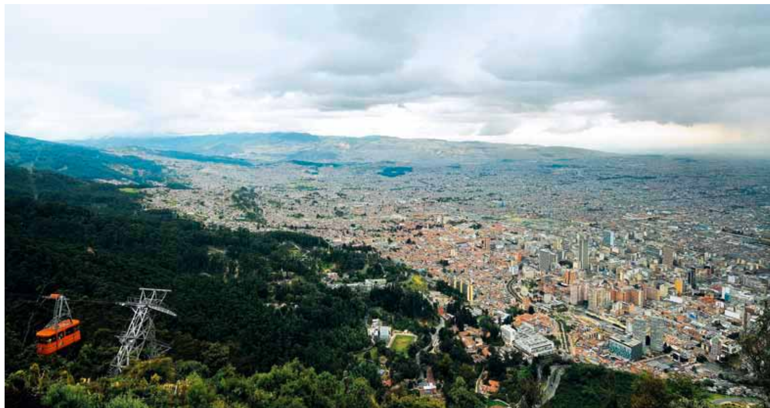
Pohled na Bogotu z Cerro de Monserrate

Catedral de Sal je co do návštěvnosti atrakce číslo 1 v Kolumbii a druhá největší solná katedrála na světě (největší je údajně polská Wieliczka). Byla postavena z bývalých solných dolů, stála 285 milionů dolarů a veřejnosti byla zpřístupněna v roce 1995. K hlavnímu římskokatolickému chrámu vede dlouhý tunel se 14ti menšími kaplemi znázorňující křížovou cestu Ježíše. Chrám leží 200 m pod povrchem, je 75 m dlouhý, 18 m vysoký a pojme až 8400 lidí. Skládá se ze tří sekcí představující narození, život a smrt Ježíše.