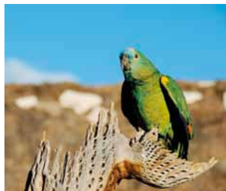
Papoušek na uschlém kaktusu