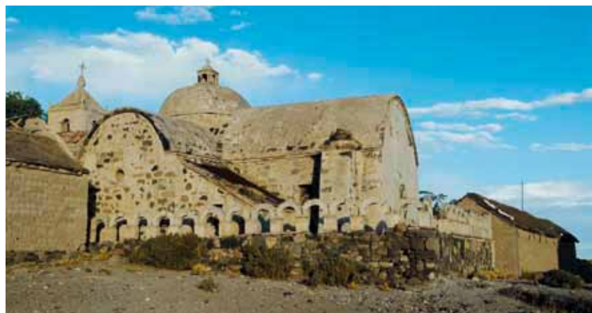
Jirira – Kamenný kostel