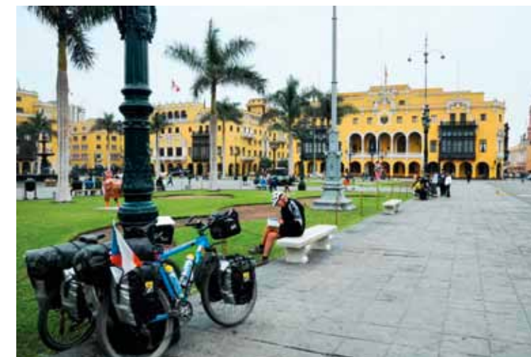
Lima - Plaza de Armas, orientujeme se po příjezdu

OSTATNÍ CENY: Plynové bomby: nabodávací 6-11 solů, se závitem malá 230 g 15-20 solů, velká 450 g 35-40 solů