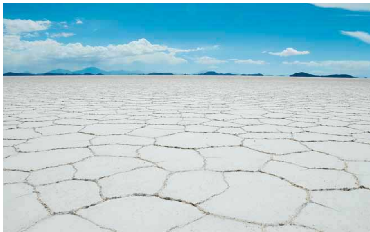
Salar de Uyuni

UBYTOVÁNÍ: Obecně velmi levné a prosté. V turistických místech 60-80 BOB, jinde 20-50 BOB za dvě osoby.